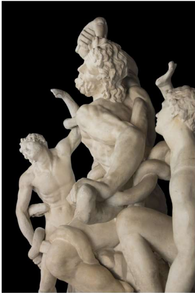
LAOCOON GALLERY - Vincenzo de' Rossi, Laocoonte (dettaglio)