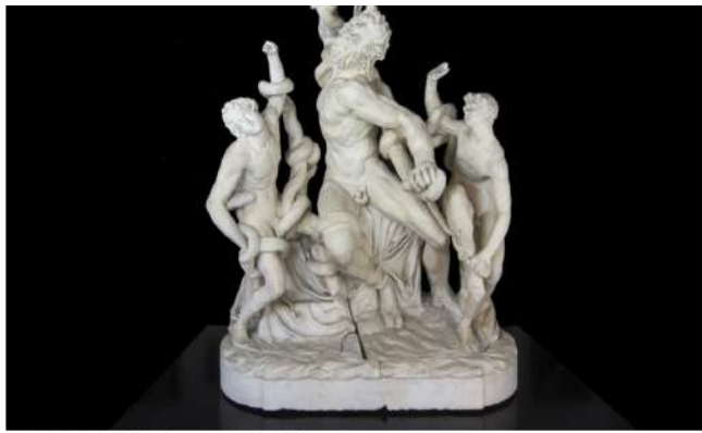
LAOCOON GALLERY - Vincenzo de' Rossi, Laocoonte