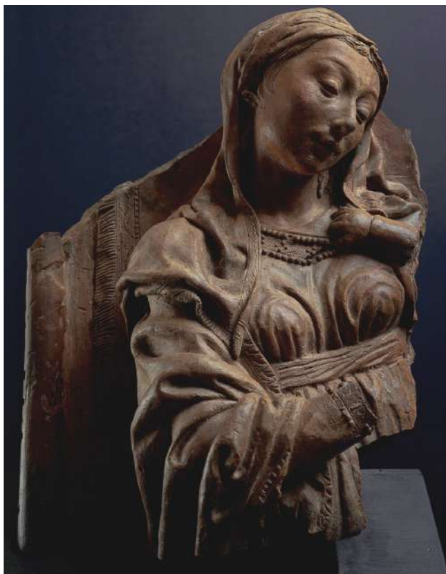
GALLERIA NOBILE – Niccolò dell'Arca (1435 circa – 1494) Frammento di Madonna col Bambino, 1400 circa. Terracotta, 36,7 x 28,8 cm.

Percorso a zig-zag tra gli highlights della BIAF. Un Carro di Fausto Meliotti, del 1972, offerto da Robertaebasta per € 160.000. Da Galleria Cantore, un raro dipinto su rame di Giovanni Lanfranco già esposto nella nota mostra dedicata all'artista parmigiano nel 2001-2002, itinerante tra Parma, Roma e Napoli, a cura di Erich Schleier. Un'intera parete dello stand di Galleria Canesso occupata da una Venere di Palma il Giovane, che incontra per la prima volta lo sguardo del pubblico. Un intenso dialogo tra Adolfo Wildt e il cinquecentesco Pedro Fernández nello spazio di Galleria Lampertico. Il Banchetto di Assalonne di Niccolò Tornioli, premiato come il più bel dipinto in mostra, a proporlo è Robilant+Voena.