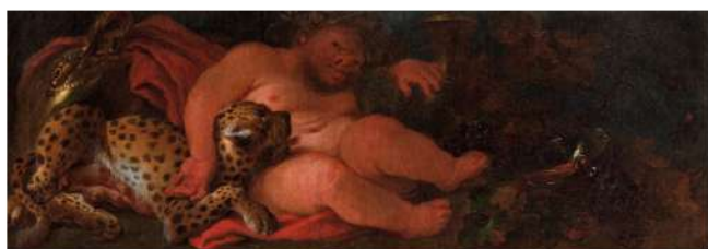
GALLERIA NOBILE – Giovanni Benedetto Castiglione detto il Grechetto (Genova, 1609-Mantova, 1664), Bacco ebbro con un leopardo, olio su tela, cm 29,8x86.