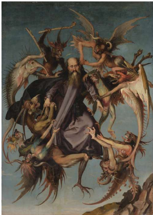
GALLERIA ORSI – Le tentazioni di Sant'Antonio

Ed eccoli, uno dopo l'altro, gli 80 espositori protagonisti di BIAF, patinati e sobri insieme, a due passi dall'Arno. A partire dalla Galleria Carlo Orsi, che punta subito su Le tentazioni di Sant'Antonio , una tavola del XVI secolo dallo straordinario impatto visivo – soffermatevi sui nove demoni ibridi, mostruosi, quasi in posa, pronti ad assalire l'eremita in levitazione. L'autore: al momento ignoto. Il prezzo: intorno a € 1 milione. «Ci si confronterà con un piccolo mistero e con un tema poco noto», rivela a exhibart Carlo Orsi, «quello dell'anti-rinascimento, ossia la diffusione di un immaginario onirico, bestiale, di stampo nordico». E aggiunge: «Anche Michelangelo, racconta Vasari, ancora alla bottega del Ghirlandaio, studia da vicino gli animali proprio per rappresentare in maniera precisa di demoni che attaccano Sant'Antonio». Similitudini che non guastano, insomma, al momento della valutazione.