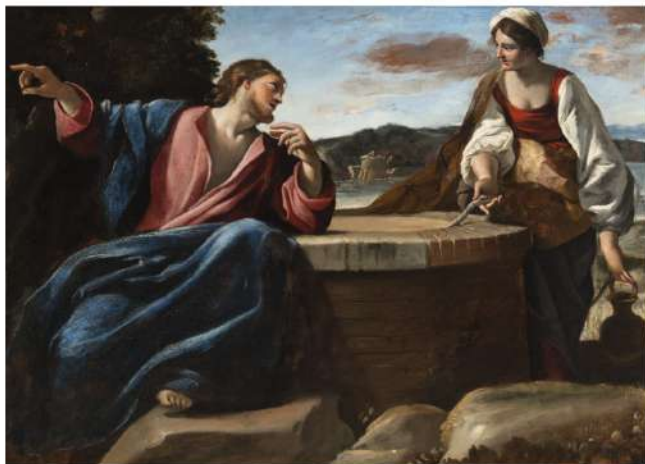
GALLERIA CANTORE – Giovanni Lanfranco, Cristo e la Samaritana al pozzo