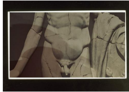
Il cugino Pons