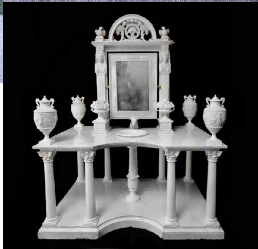
Massa, inizi del XIX secolo, toiletta in marmo bianco. 198 (h) cm x 151 cm.