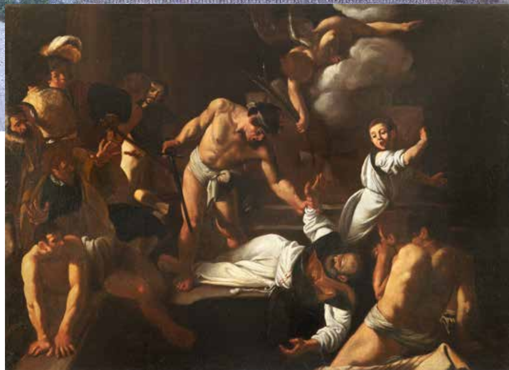
Roma, Sec. XVII ost Martirio di San Matteo da Caravaggio nella cappella Contarelli San Luigi dé Francese Cm 77,5x106