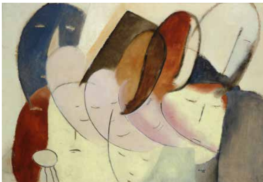
A sinistra: Marisa Mori: La divisione meccanica della folla , 1933. Olio su cartone, cm 71x100