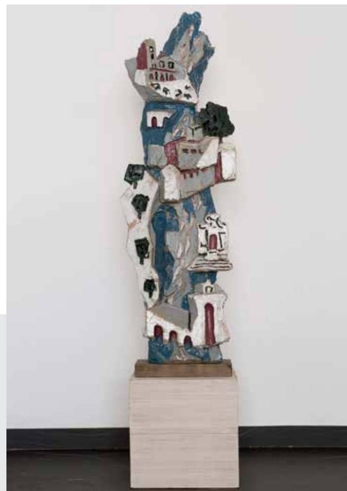
A destra: Leoncillo: Il corso del Tevere , 1955. Terracotta policroma smaltata, cm 30x19x13