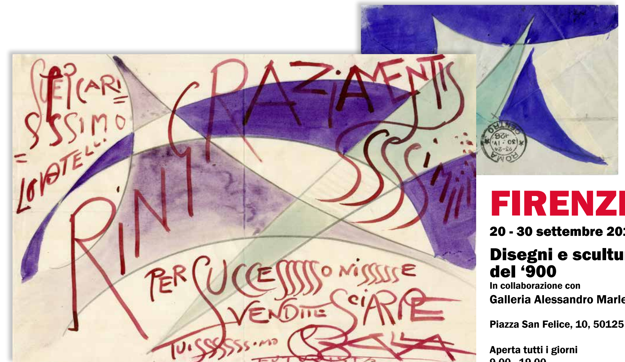
Giacomo Balla, Busta e lettera al Conte Filippo Lovatelli, 1926, matita e acquerello su carta, cm 9,7 x 14 - 19,4 x 28

Preview giovedì 14 settembre 16.00 - 21.00 15 - 17 settembre 11.00 - 19.00