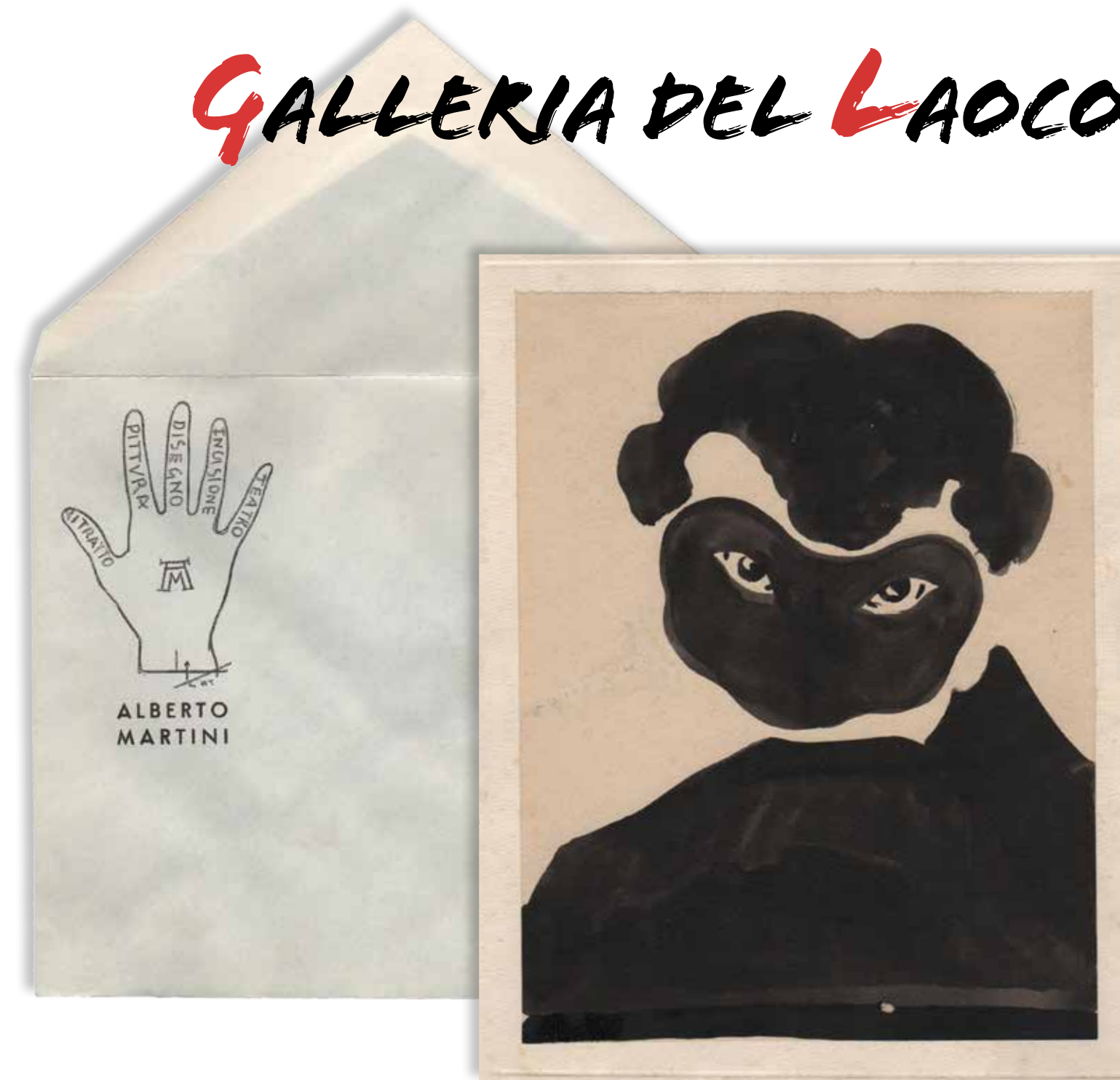
Alberto Martini, Busta da lettera intestata e Poema delle Ombre, 1904-10, china acquerellata su carta, cm 19 x 15