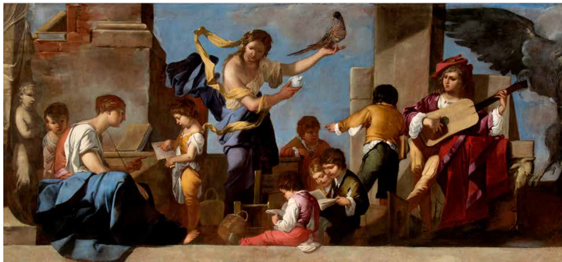
Olio su tela, ciascuno cm 156 x 339

Riuniti dopo secoli due capolavori di Giulio Carpioni (1613 - 1676) uno dei più poetici pittori del Seicento veneto.