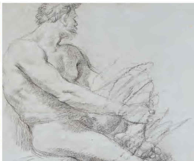
Opere in esposizione - A sinistra "Madonna con Bambino e Santi" di Matteo di Giovanni, a destra "Nudo maschile seduto" di Annibale Carracci